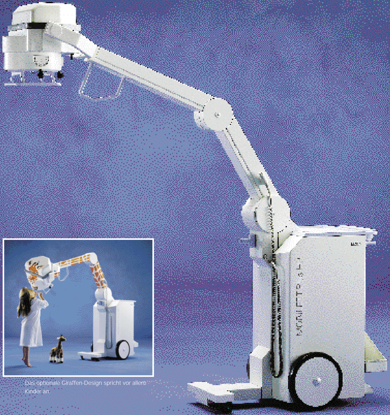
Das optionale Giraffen-Design spricht vor allem Kinder an.